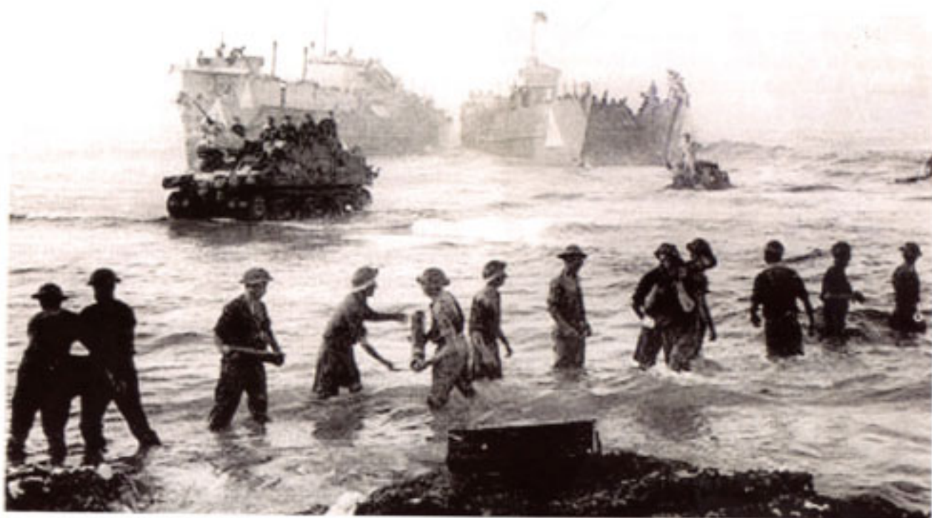
Sbarco in Sicilia

see what was happening, so off we went! - Geoffrey ebbe questa meravigliosa idea: che Taormina non fosse difesa; quindi, come bene facemmo, andammo a vedere quale fosse la situazione! Girando l'angolo ci trovammo faccia a faccia con una mezza compagnia di soldati italiani di fanteria con dei fucili antiquati. Li salutammo e ci avvicinammo, chiedendo dell'ufficiale comandante. Un tenente e un sottotenente si fecero largo tra i soldati, noi chiedemmo che ci consegnassero le pistole, cosa che fecero piuttosto malvolentieri. Dopo un minuto si venne a sapere che ci avevano scambiati per tedeschi. Quando scoprirono che eravamo inglesi, si misero a ridere. Gli uomini, rallegrati, ci tesero le mani e ci offrirono da bere e da mangiare".