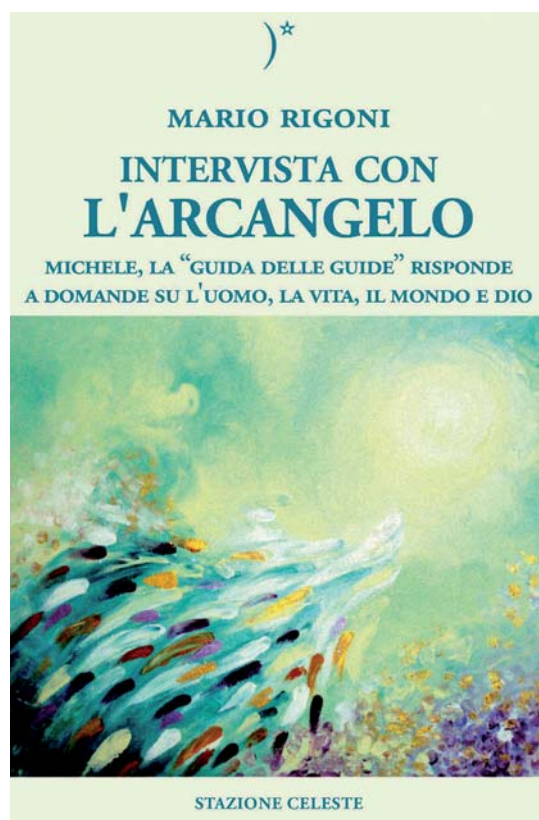
Copertina Libro "Intervista all'Arcangelo Michele"